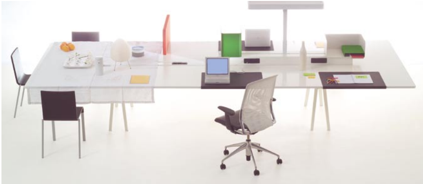
Produkt: Joyn | Designer: Ronan und Erwan Bouroullec