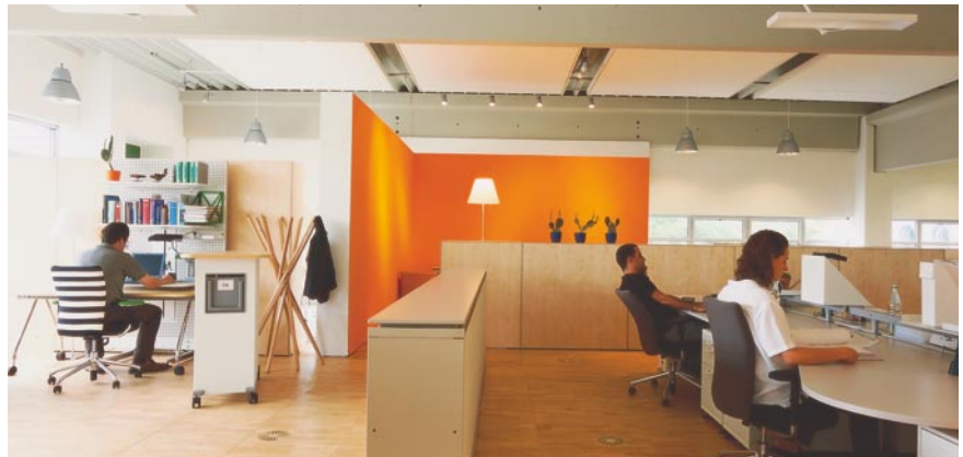
Vitra Office, Weil am Rhein | Architekt: Sevil Peach

Der sehr schnelle Produktivbetrieb hatte mehrere Ursachen: Im Vorfeld wurde im Entwicklungsplan sehr genau definiert, welche Funktionen gefordert werden. Während der Implementierung gab es so keine Verzögerungen aufgrund von Änderungswünschen oder Erweiterungen der Anforderungen. Der modulare Aufbau der Software ermöglichte eine Schritt-für-Schritt-Implementierung. Von Kundenseite wurde